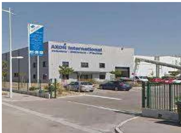
Siège du Groupe Axon International situé à Vinon sur Verdon